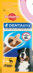
Large (25+ kg)