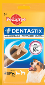
Small (5-10 kg)